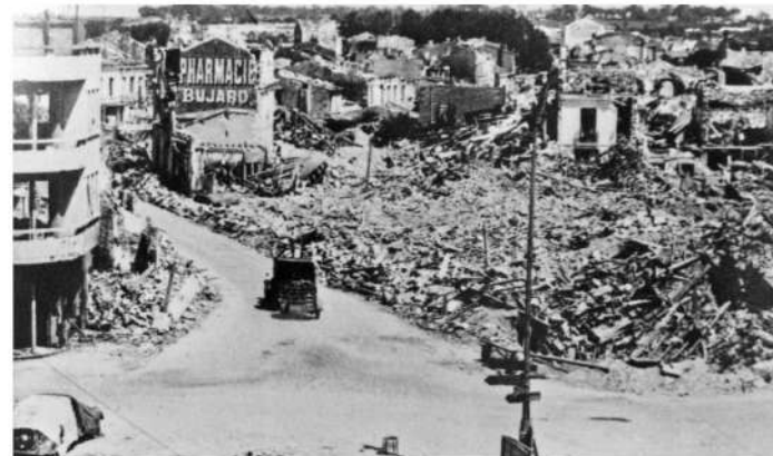
Royan après les bombardements du 5 janvier 1945. La ville est bombardée par un raid aérien des Alliés, qui pensaient qu'elle était peuplée d'Allemands. La cité est détruite à plus de 80 %. 442 civils meurent