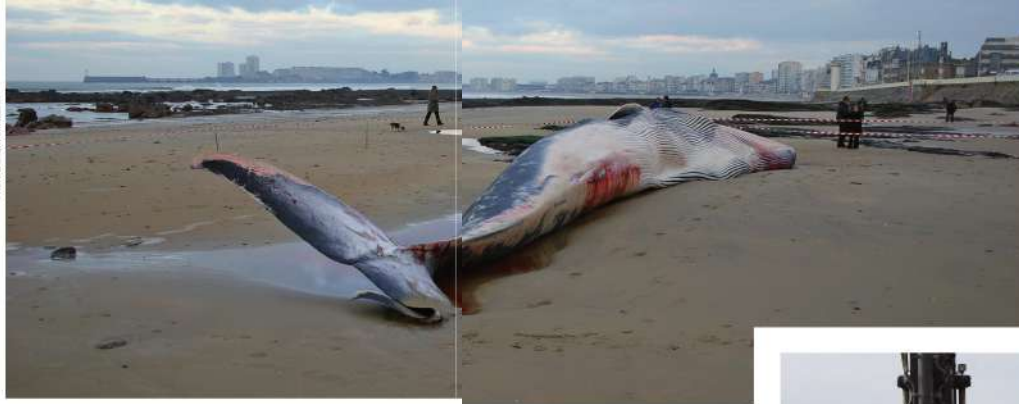
Impressionnant échouage en janvier 2013 d'un rorqual commun de 20 mètres sur la grande plage des Sables-d'Olonne. Pelagis est intervenue pour examiner et évacuer l'animal décédé d'une septicémie bactérienne