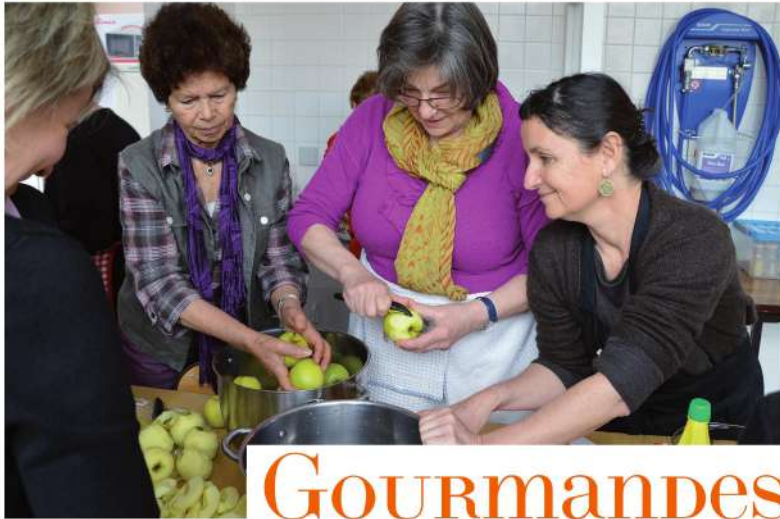
Préparation d'un chutney de pommes aux échalotes lors d'un atelier de cuisine