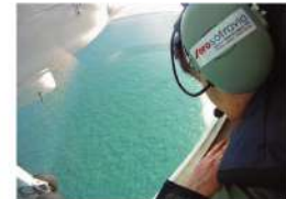
Pendant la campagne SAMP, les experts ont effectué leurs observations des eaux de la Manche, de l'Atlantique et de la Méditerranée à 180 mètres d'altitude