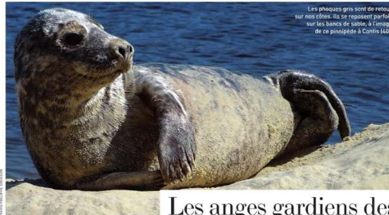
Les phoques gris sont de retour sur nos côtes. Ils se reposent parfois sur les bancs de sable, à l'image de ce pinnipède à Contis (40).