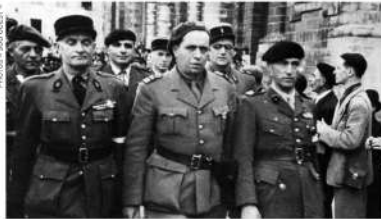
En haut et en bas à gauche : libération de La Rochelle. En bas à droite : libération de Royan, peloton de chars du 2 e escadron du 12 e cuirassiers de la division Leclerc devant la maison du maire des Mathes