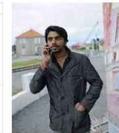
Originaire de Madras, ce marin indien téléphone aux siens après s'être procuré une nouvelle batterie pour son portable.